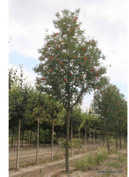
SO - Sorbus aucuparia 'Sheerwater Seeding'