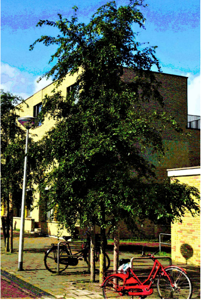
UL - Ulmus 'Rebella'