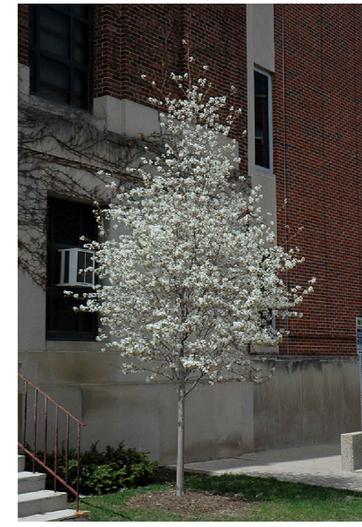
AA - Amelanchier 'Autumn Brilliance'