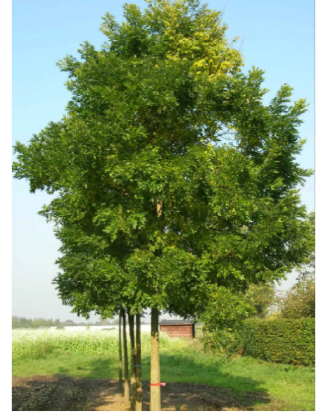
ST - Styphnolobium japonicum 'Harry van Haaren'