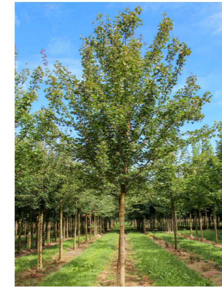
AR - Acer campestre 'Red Shine'