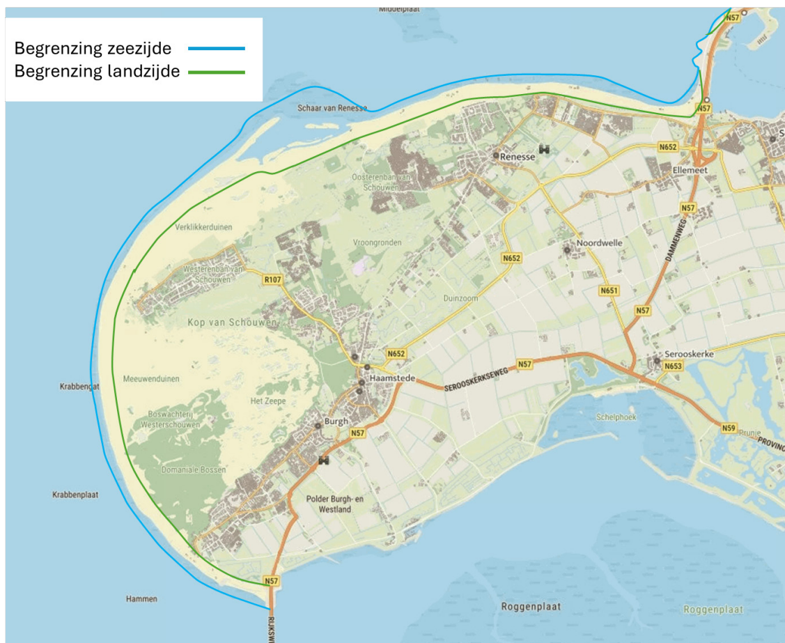
Figuur 1: Begrenzing reikwijdte strandbeleid

Binnen het werkingsgebied van het strandbeleid heeft dit beleid betrekking op het strand tussen de laagwaterlijn en de duinvoet aan de landzijde. Dit betekent dat de stranden en de 1e duinenrij inclusief daarin aanwezige paden (inclusief en na de slagboom) onderdeel uitmaken van het beleid. De uitgestrekte duingebieden die overlopen in het bos van de Boswachterij Westenschouwen en de duingebieden in Natura 2000 gebied Kop van Schouwen vallen hier niet onder. Parkeerplaatsen en voorzieningen buiten het werkingsgebied hebben uiteraard een nauwe relatie met het strandbeleid, maar vallen buiten het strandbeleid.