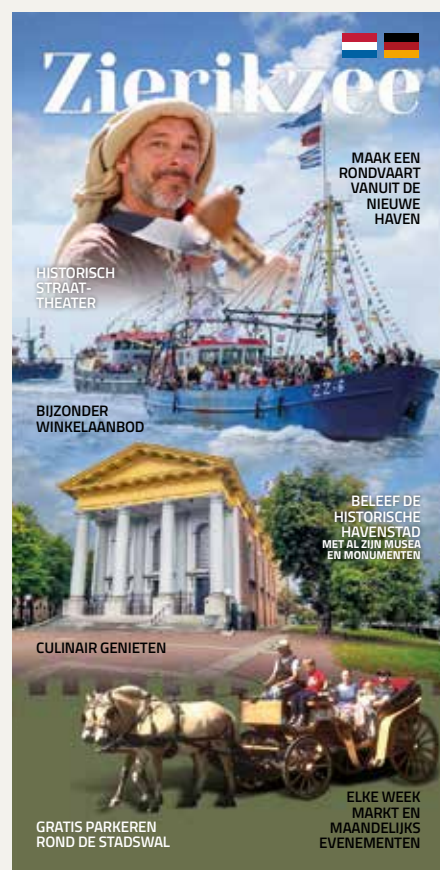
Cover van de wervende Zierikzee folder.