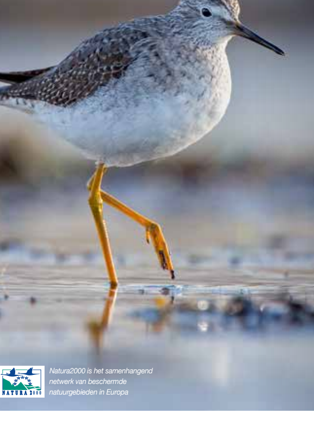
Natura2000 is het samenhangend netwerk van beschermde natuurgebieden in Europa

Strand- und Seegeulen in einem weiträumigen Naturschutzgebiet? Schouwen-Duiveland bietet Ihnen genau das! Die See ist hier Teil des weitläufigen und geschützten Naturraums des 'Voordelta'. Tiere nutzen die flachen Gewässer, trockenfallenden Sandbänke und Schlickzonen als Nahrungs- und Rastgebiet. Für zahlreiche Vogel- und Fischarten sowie Seehunde ist das Voordelta der Ort zur Aufzucht ihrer Jungen sowie zum Ausruhen während des großen Vogelzugs. Deshalb wurden für die Tiere Rastzonen eingerichtet und ist das Areal als Natura 2000-Gebiet ausgewiesen. Eines dieser Ruhegebiete liegt vor der Küste von Renesse: die Middelpaalt. Hier rasten Dutzende von Seehunden. Ein prächtiges Schauspiel, das man vom Strand aus gut beobachten kann. Die zahlreichen und in den Dünen von Schouwen-Duiveland brotenden Seenvögel suchen ihre Nahrung im Voordelta. Vor allem im Mai und Juni kann man sie hin- und herfliegen sehen. Mehr Informationen? www.voordelta.nl