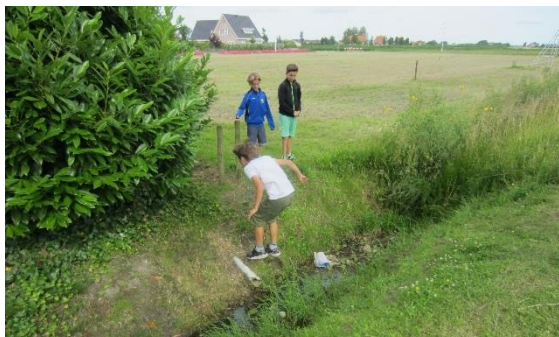
Figuur 7 Slootje springen in Nieuwerkerk

De basisschoolkinderen die mee waren met de rondgang hadden geen enkele moeite om de begeleiders mee op sleeptouw te nemen door het dorp. Ze kenden iedere verstopplek, sloot waar je over kon springen en schommel. Nieuwerkerk wordt daarom ook als één speelwijk gezien. Tijdens de rondgang met jeugd van basisschool Duiveland kwam naar