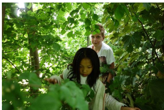
Figuur15 Huttenbouwen in de bosjes aan de Tuinweg

"Wij hebben sinds kort een mooi speelpark bij het voetbalveld op Zonnemaire. We missen alleen nog echt een klimtoestel. (...) En een veilige oversteekplaats!" Ouder, enquête