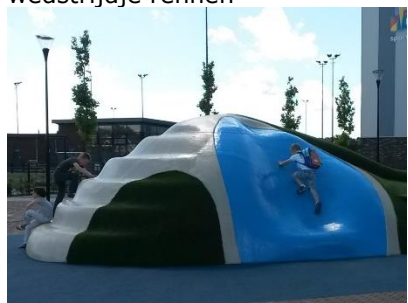
wat je zelf maar bedenkt!