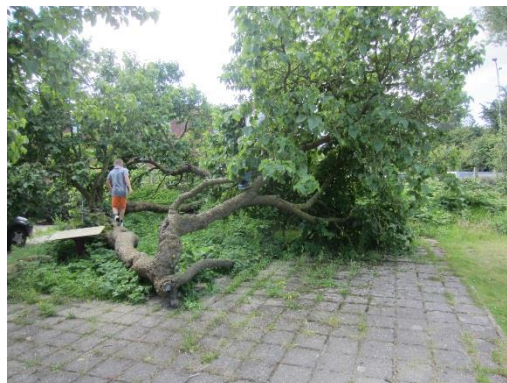
Figuur 9 Moerbeiboom als speelaanleiding op de Lindelaan (monumentale boom)

Voor de ruim 110 kinderen en jeugdigen, naar verwachting sterk afnemend, zou gezien de normen minimaal 1 krachtig ingerichte centrale plek voor spelen en sporten moeten zijn. Die is er nu niet. Voorgesteld wordt om het schoolplein 't