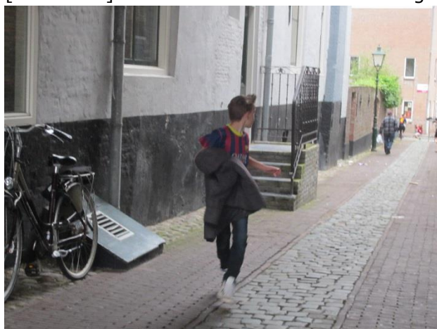
Figuur 12 In rustige smalle straatjes wordt flink gerend door de jeugd tijdens de rondgang door de wijk

Voor de ruim 300 kinderen en jeugdigen, naar verwachting toenemend, zouden gezien de normen minimaal 5 speelplekken aanwezig moeten zijn, met minimaal 2 ingericht als centrale plek. Als centrale speelplekken zijn de speelplekken aan het H.J. Doelemanplein [422190-0] en aan de Mosselboomgaard [421757-0] geschikt. Er is daar voldoende ruimte, de plekken liggen in het zicht en de inrichting is hier ook al op de doelgroep afgestemd. Bewoners stellen hier voor om een aantal aanpassingen te doen zodat de plek minder overlast veroorzaakt en aantrekkelijker wordt voor kinderen. Het voorstel is om een groot aantal van deze aanpassingen over te nemen, uitgezonderd het kunstgras. Verder is het voorstel om hier met jongerenwerk en de jongeren te zoeken naar een alternatieve locatie voor het ontmoeten en kletsen. Het nieuwe groen zal zorgen voor een zachtere uitstraling van de plek. Bij de speelplek aan het H.J. Doelemanplein ontbreken sportvoorzieningen, die zijn aanvullend te vinden bij het trapveld aan de Slabberswerf [421659-1]. Het voorstel is om de inrichting van dit trapveld te verbeteren zodat er meer