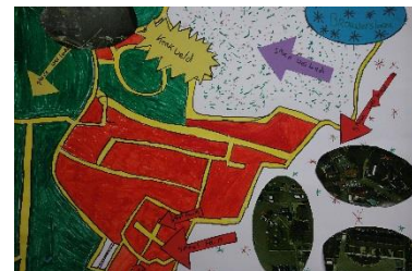
Figuur 2 Brouwershaven volgens de leerlingen van de Schoener

De speelplek in de oude stad aan de Spuislop [422569-0] is vooral leuk voor kinderen, voor jeugd is hier weinig uitdaging. Er wonen minder dan 5 kinderen in een straal van 350 meter rondom de speelplek. Wanneer de toestellen afgeschreven zijn is het advies om deze niet meer