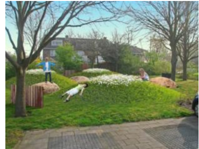
rusten en bloemen plukken