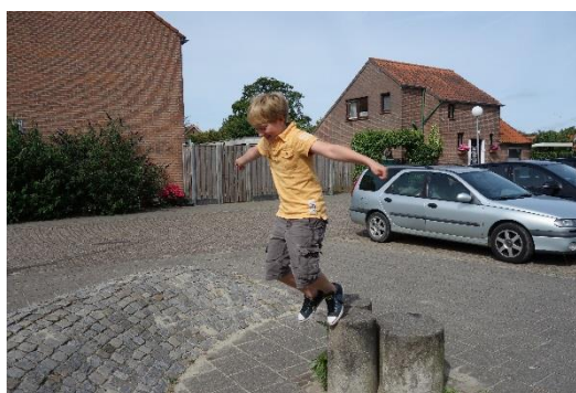
Figuur 10 Speelaanleiding in Scharendijke

Het skatepark [422128-0] aan de rand van het dorp wordt weinig gebruikt. De skatevoorziening is niet erg uitdagend en het aantal skaters in het dorp is beperkt. Het advies is daarom de skatevoorzieningen op het eiland te clusteren. De skaters van Scharendijke kunnen dan terecht in Brouwershaven. Er wonen nu minder dan 50 jongeren in Scharendijke maar de verwachting is dat dit aantal de komende 5 jaar gaat groeien naar 60 jongeren. Het trapveldje met minidoeltjes aan de Klaverstraat [421691-0] is voor jongeren en oudere jeugd te klein. Als er op de plek van het skatetoestel een trapveld met grote goals en een bankje gerealiseerd wordt, dan kan deze locatie als sport- en ontmoetingsplek voor jongeren en oudere jeugd functioneren.