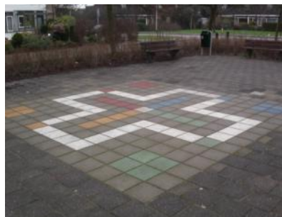
mens erger je niet spelen