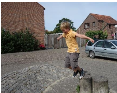
showen en klimmen