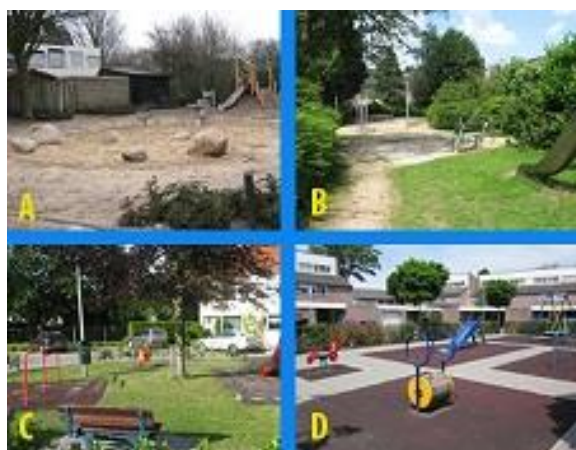
Figuur 16 type speelplek