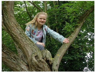
tikkertje spelen en klimmen