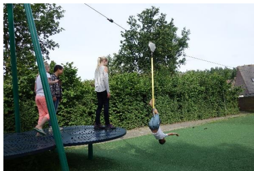
Figuur 6 Kabelbaan in kerkwerve

In Kerkwerve wonen bijna 60 kinderen en jeugdigen. Er is een formele speelplek in de Beatrixstraat [421759-0] die voor zowel kinderen van 0 tot en met 5 jaar en jeugdigen van 6 tot en met 11 jaar interessant is. De jeugd