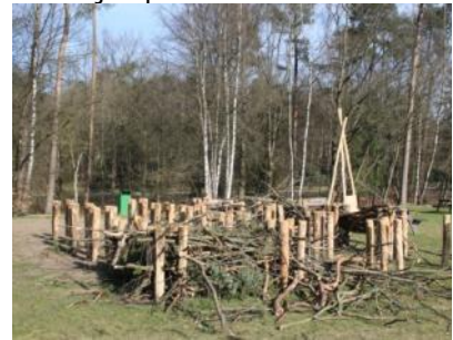
wat je zelf maar bedenkt!