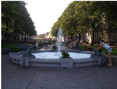
Op straat of stoep kun je dan

Voorbeelden hoe in de verharding speelprikkels te plaatsen zijn: