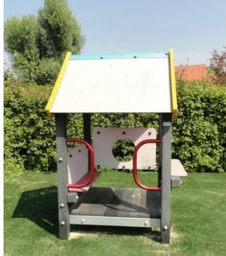
Figuur 5 Speelplek [422256-0] is vooral leuk voor kinderen

Ellemeet ligt aan de Brouwersdam met in de buurt zowel het Noordzeestrand als het Grevelingenmeer. Het dorp is compact en wegen zijn relatief rustig. Rondom het dorp liggen vooral akkerlanden en vakantieparken. Jeugdigen kunnen zelfstandig in het hele dorp komen. Ellemeet wordt daarom als één speelwijk behandeld.