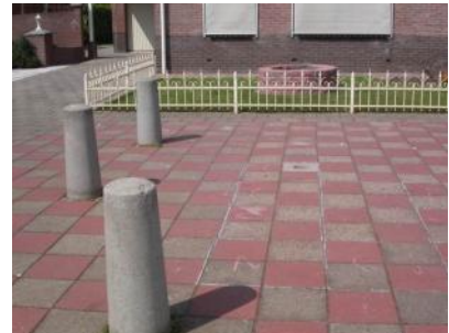
krijten en bokspringen