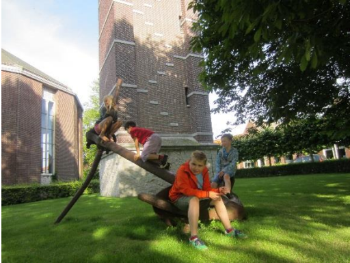
Figuur 8 Bespeelbare kunst bij kerk

De basisschooljeugd van 't Stoofje in Ouwerkerk lieten onder andere de wethouder enthousiast alle informele en formele speelplekken zien. De kinderen gaan vaak bij elkaar in de tuin, langs de randen van het dorp in het groen en bij de diverse campings spelen. Er is ruim voldoende informele speelruimte om kikkervisjes te vangen, hutten te bouwen en gewoon even lekker te kletsen. Ouwerkerk is totaal een 30 kilometerzone, er zijn geen grote barrières voor zelfstandig spelen van kinderen en jeugd. Het meeste verkeer is afkomstig van de Koningin Julianastraat. Ouwerkerk is daarom één speelwijk.