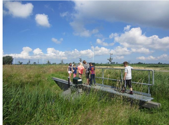
Figuur 14 Tijdens de rondgang laat de jeugd zien hoe ze spelen bij de sloten

vooral de jeugdigen de plek aan de Watergang [422460-1] aan te wijzen. De inrichting laat volgens de jeugd van de rondgang te wensen over. Ze vinden de inrichting saai en niet aansluiten bij hun behoefte. Voorstel van de jeugd was om hier meer verstopplekjes te maken en een uitdagend toestel bij te plaatsen. Er is volgens hen meer beschutting nodig tegen de zon en wind. Ook het schoolplein van de Theo Thijssenschool [421705-1] is vooral voor de actieve voetballende jeugd een belangrijke plek. Bij de woningen nabij de Pijlerdam en Nassaulaan is er meer ruimte in eigen tuin dan in de openbare ruimte. De speelplek aan de Slaperdijk [422398-0] kan gezien de hoeveelheid informele speelruimte en het aantal kinderen op termijn worden omgevormd naar informele speelruimte. De speelplek aan de Veenlaan [422421-0] heeft een functie voor de scouting, maar verder niet voor omwonende kinderen. Ditzelfde geldt voor de speelplek aan het voorplein van de Laco [421817-4]. Zodra de wijk gaat uitbreiden moet een tweede stevig ingerichte steunplek gezocht worden in het nieuwe plan.