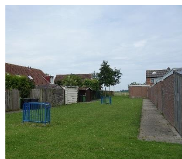
Figuur 1 Trapveld [422493-0] ligt dicht op de woningen