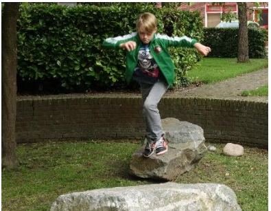
springen en ...