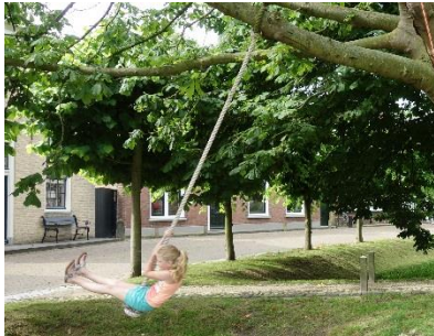
In groen kun je dan ...

Voorbeelden hoe in het groen speelprikkel te plaatsen zijn: