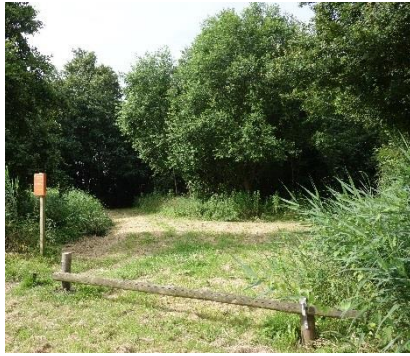
Figuur 11 Er is veel te beleven in de Sirsebosjes

Sirjansland is een klein dorp in het buitengebied tussen Bruinisse en Dreischor. Het dorp is omringd door agrarische bedrijven, een grote camping en ligt vlakbij het Grevelingenmeer. Zowel kinderen van 0 tot en met 5 jaar als jeugdigen van 6 tot en met 11 jaar lopen zelfstandig door het dorp. Jeugdigen gaven zelfs aan dat ze zelfstandig op de fiets naar de sportclubs in Bruinisse gaan. Tijdens de rondwandeling lieten de jeugdigen zien waar ze spelen. Ze gaan vaak naar de Sirsebosjes waar ze hutten bouwen of gewoon op het hek gaan zitten en naar auto's zwaaien. Ze klimmen in de bomen en houden van de rust en ruimte in het dorp. Ook spelen ze regelmatig op de camping aan de rand van het dorp. Sirjansland is één speelwijk.