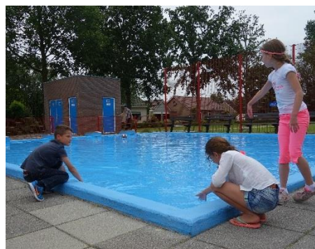
Figuur 3 Het kikkerbadje in het Westerplantsoen [422081-1] is erg populair.

Een andere plek die goed beoordeeld wordt is het nieuwe park in de nieuwbouwwijk in de buurt van de Riekusweel [422322-2]. Vooral de trekpont en de kabelbaan zijn populair. Deze plek functioneert goed als centrale speelplek voor kinderen en jeugd.