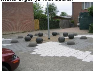
gewoon zitten en...