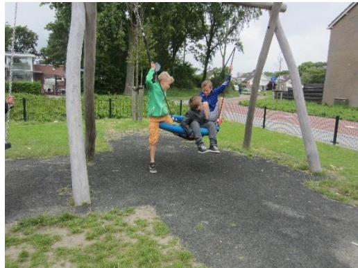
Figuur 13 Kinderen genieten van de nestschommel bij de speelplek aan de Kabellaarsbank

De basisschooljeugd van de Jan Wouter van den Doelschool liet ons de wijk zien. Deze kinderen kennen de wijk goed en ze waarderen de vele speelplekken en afwisseling. De speelplekken voor kleinere kinderen vonden ze saai, maar wel mooi ingericht voor de jongere doelgroep. Het vele groen, onder andere langs de Kabellaarsbank gebruikten ze intensief in hun spel, zelfs tijdens schooltijd worden de bosjes nabij de winkel goed gebruikt. Bij de rondgang bleek dat de jeugd ook een groot speelbereik had, slechts door tijdgebrek zijn we niet door de hele wijk gekomen. Er zijn veel stoepen, fietspaden waardoor kinderen en jeugdigen prima zelfstandig kunnen verplaatsen. Stoepkrijten en skaten is geen probleem. Er zijn ruime veldjes waarop een balletje getrapt kan worden en ook in het noorden van de wijk liggen veel bosjes waar verstoppertje gespeeld kan worden of hutten gebouwd kunnen worden. Kortom de informele speelruimte in Poortambacht is prima voor kinderen en jeugd. De gehele wijk is ingericht als een 30 kilometerzone, waardoor er geen barrières zijn voor jeugdigen. Voor kinderen zijn de ontsluitingswegen zoals de Haringvlietstraat, Scheldestraat en Ooster-scheldestraat wel barrières. De wijk Poortambacht wordt als één speelwijk gezien.