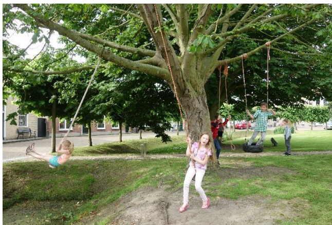
Figuur 4 Schommelen in de Kastanjes in Dreischor

Er wordt vooral gespeeld met toestellen die door bewoners zelf gemaakt zijn. In de oude kastanjes naast de kerk zijn schommels van touw en autobanden gemaakt waarmee de jeugd over de gracht slingert. Daarnaast is in samenwerking met de Droomclub het Droompark gemaakt achter de Molenweg. Hier is een pluktuin, een blotevoetenpad, een wilgentipi en nog veel meer. Jeugdigen klimmen daarnaast graag in de boom bij de bushalte aan de Stoofweg.